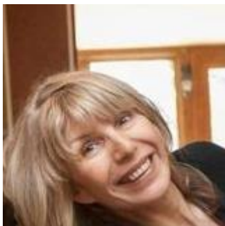
Геновева Димитрова България